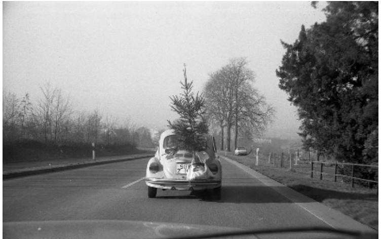
VW-Käfer mit Weihnachtsbaum am Heck